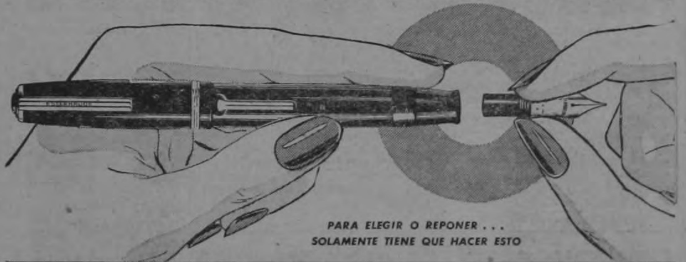
PARA ELEGIR O REPONER... SOLAMENTE TIENE QUE HACER ESTO

EL PUNTO es lo más importante en una pluma. Por eso compre una Esterbrook —la pluma que le ofrece a USTED el punto adecuado para escribir a su gusto. Esterbrook le proporciona más estilos de puntos que cualquier otra pluma. Ud. escribe con el punto que se adapta exactamente a su estilo de letra. Y todos los Puntos Esterbrook son intercambiables y renovables, pudiendo reemplazar el suyo instantáneamente por otro idéntico en caso de que lo dañase.